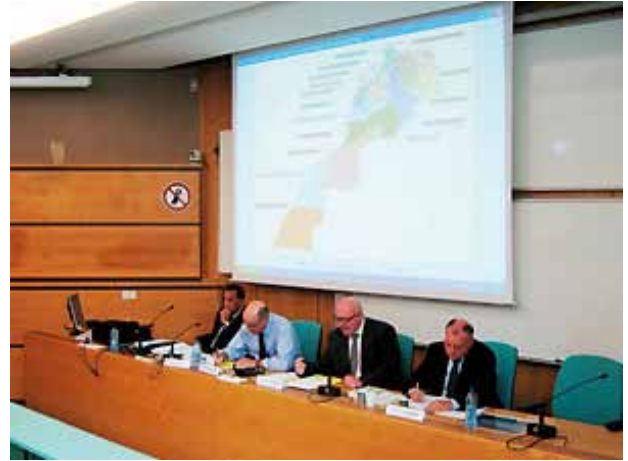
Table-ronde à l'ENA

Dans le cadre du module « Territoires » de la scolarité des élèves de l'École nationale d'administration à Strasbourg, une table-ronde sur le thème « Régionalisation et développement au Maroc » a été présentée le 10 juin 2010.