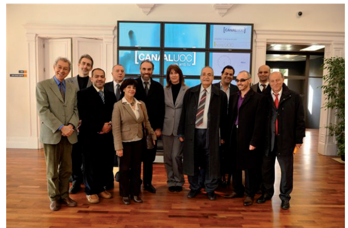
L'équipe professorale du Master avec Rectrice de l'UOC